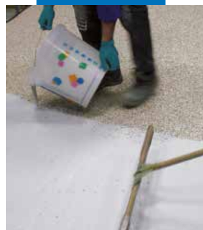
Ultratop uzklāšana uz nocietējuša klājuma, kas izveidots izmantojot dabīgo pildvielu + Mapefloor I 910 maisījumu