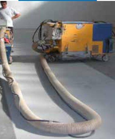
Pamatnes sagatavošana skrotējot