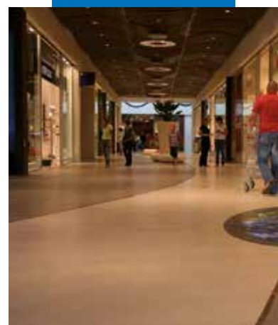
Grīda, kas izveidota izmantojot Ultratop