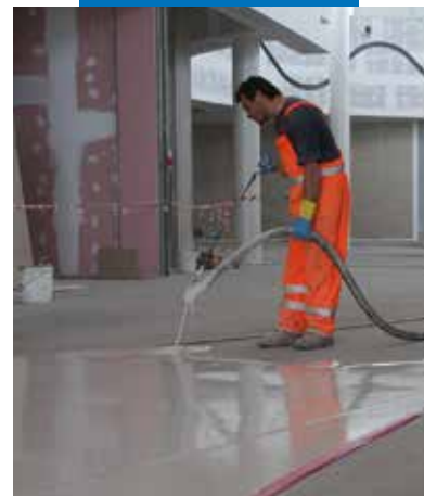
Mehānizēta Ultratop iestrāde