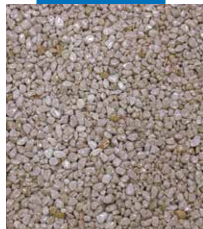
Dabīgo pildvielu + Mapefloor I 910 maisījuma uzklāšana