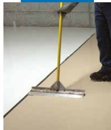
Ultratop slāņa izlīdzināšana nekavējoties pēc uzklāšanas