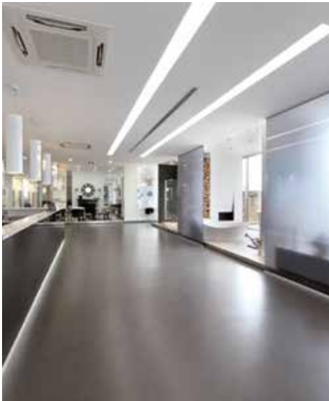
Ekspozīciju telpa Quartarella Altamura (BA) - Itālija. Ultratop antracīta - "dabīgs efekts"

Lai atvieglotu virsmu kopšanu, tās noslēgumā apstrādāt ar Mapelux Lucida vai Mapelux Opaca vasku.