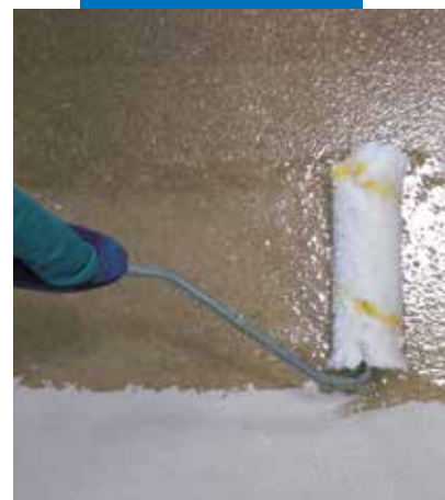
“Terrazzo alla veneziana” stila grīda. Mapefloor I 910 uzklāšana

Pēc Ultratop virsmas pulēšanas darbu pabeigšanas, uz tās uzklāt traipu noturīgo, ūdeni un eļļu atgrūdošo noslēdzošo sastāvu Mapecrete Stain Protection .