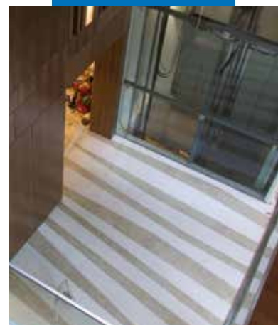
Viesnīca Design - Budapešta - Ungārija. "Terrazzo alla veneziana" stila grīda, Ultratop