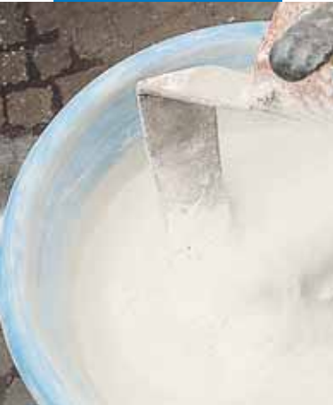
Mape-Antique MC javas sagatavošana