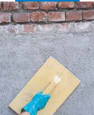
Jaunizveidota Mape-Antique MC apmetuma virsmas izlīdzināšana