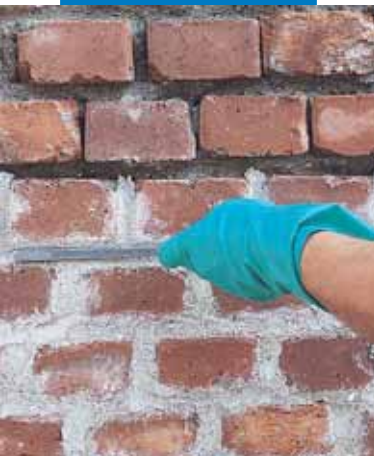
Kieģeļu mūra šuvju atjaunošana

apstākļos, piem., stipra lietus, sārnu, sāļu, kapilārā mitruma, straujas temperatūras maiņas gadījumos. Sadaļā Tehniskie dati ir ievietotas Mape-Antique MC īpašības, kādas piemīt produktam plastiskā un sacietējušā stāvoklī.