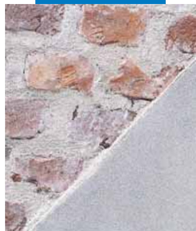
2 Detajas: Mape-Antique MC izmanto šuvju atjaunošanai un apmetuma izveidei