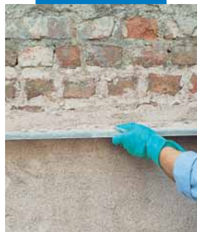
Mape-Antique MC apmetuma izveide