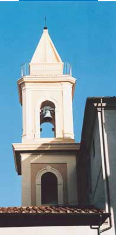
Campanile restaurato con Mape-Antique MC

RAŽOTĀJS: Mapei S.p.A., Via Cafiero 22, 20158 Milan, Italy IZPLATĪTĀJS: SIA "Velve M.S. Tehnoloģijas", Ganību dambis 31, LV 1005, Rīga tālr.: 67460990, fakss: 67460996, mājas lapa: www.velvemst.lv